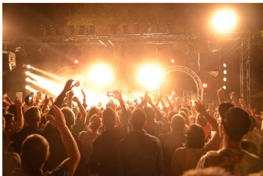
Na festiwalowych scenach pojawią się znane zespoły szantowe.