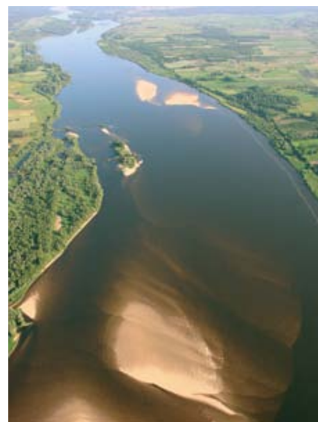
Wisła w okolicach Bobrownik.

Festiwal Wisły to cztery dni spotkań z rzeką, z tradycją nadrzeczną, z ludźmi, którzy rekonstruuja dawne drewniane jednostki - większe szkuty, galary i baty, którymi kiedyś spławiano Wisłą towary, a także mniejsze łodzie służące głównie do połowu ryb, czyli zwinne lejtaiki i miejscowe nieszawki. Te ostatnie, o charakterystycznie zadartych dziobach, są symbolem rzecznej pływania po tutejszym odcinku Dolnej Wisły. Wsiąść na łódkę nieszawkę i ruszyć na zagłę w górę rzeki szukając krętej trasy między przykosami - to zrozumieć Wisłę.