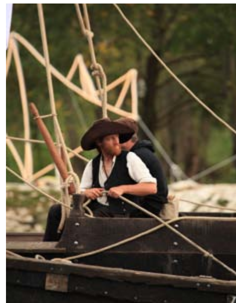
Francuscy flisacy wybierają się na Wisłę.

Podczas Festiwalu Wisły zaprezentują się też ze swoimi jednostkami rzeczni żeglarze z Francji, znawcy Loary, rzeki nad którą, w Orleanie, odbywa się największy festiwal rzeczny w Europie. Będą też rzemieślnicy wyrabiający sieci, beczki, liny i oczywiście łodzie. W tym najbardziej magiczne - długie topolowe dłubanki. Zagrają renomowane zespoły szantowe, wystąpią artyści.