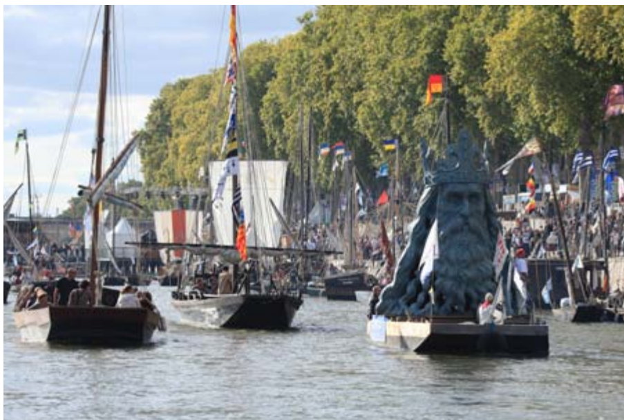
Parady są atrakcją festiwali rzecznych. W Orleanie sensację wzbudził polski król.