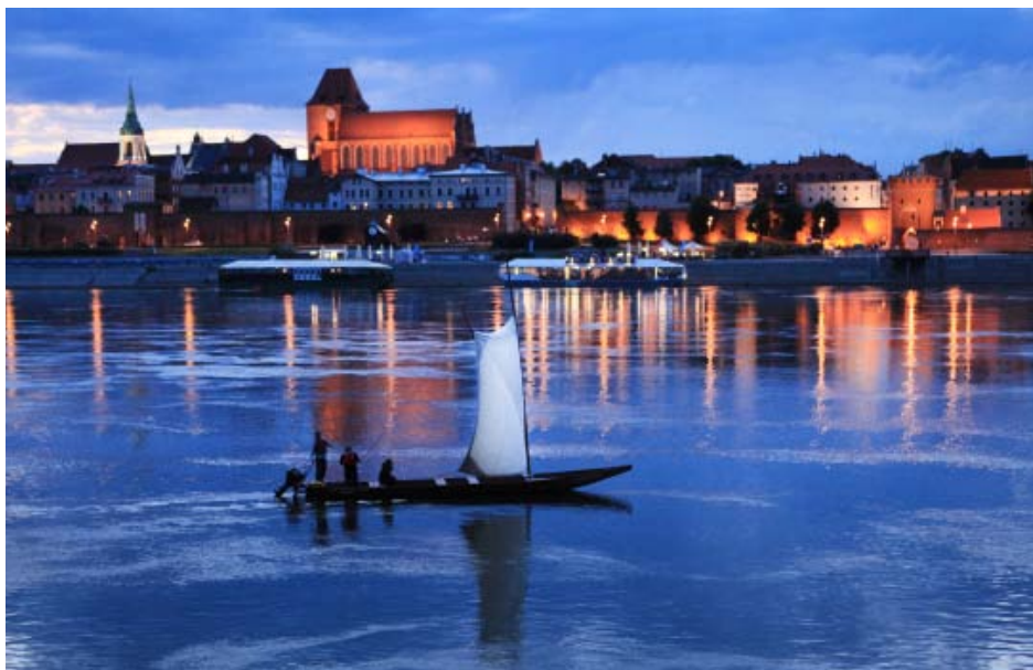
Panorama Torunia - jeden z 7 Cudów Polski.

Cztery dni z Królową Polskich Rzek. Tradycja, przygoda, zabawa, koncerty, pokaz rzemiosła i bogactwa smaków. Włocławek, Nieszawa, Ciechocinek, Toruń. Jeden z najbardziej malowniczych odcinków Wisły. Wyspy z ostojami dzikiej przyrody, tajemnicze wraki, a wokół tętniące nadwiślańską tradycją i kulturą miasta oraz uroczę wsie związane od wieków z tą wyjątkową rzeką.