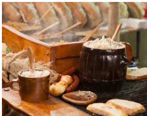
Podczas Festiwalu nie zabraknie regionalnych potraw.

Festiwal Wisły to także prezentacja nadwiślańskich smaków. (I to nie tylko z tego odcinka rzeki). Od nalewek, po tradycyjny chleb, sery, powidła, przetwory i wszelakie mięsne przysmaki. W trakcie Festiwalu rozegrany zostanie Turniej Nadwiślańskich Smaków o tytuł Nadwiślańskiego Smaku 2017. O jego wyborze współdecydować będą wszyscy goście i uczestnicy Festiwalu.