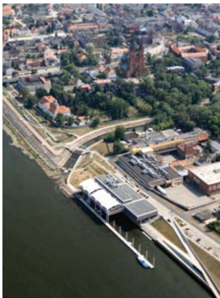
Nowoczesna marina we Włocławku.