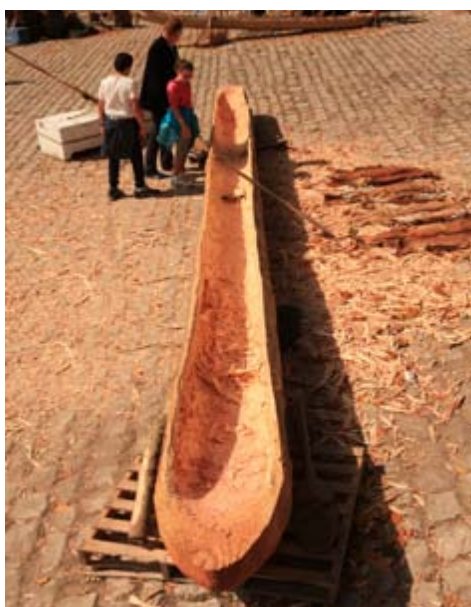
Zobaczymy jak robi się topolową dłubankę.

Festiwal Wisły 2017 zaprasza tych, którym Wisła jest droga. W Roku Rzeki Wisły uczcijmy ją szczególnie. Odcinek objęty działaniami festiwalowymi, od 675 do 735 kilometra rzeki, nie dzieli oczywiście Wisły w żaden sposób. Królowa polskich rzek ma tysiąc kilometrów. Cała jest atrakcyjna, nasycona tradycją, ściśle związana z historią Polski, pełna zwyczajów i smaków, których na Festiwalu nie zabraknie.