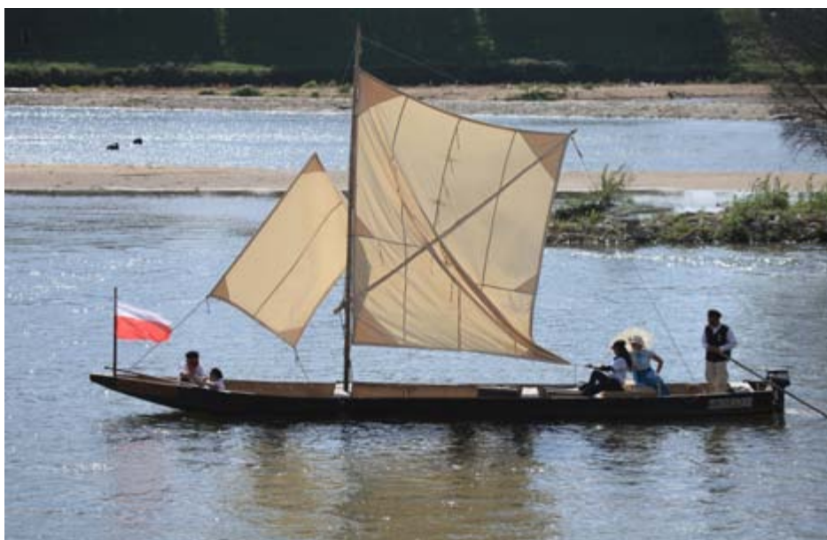
Bat wiślany „Zygmunt” przemykający pomiędzy wiślаныmi łachami.