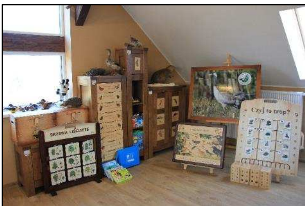
Sala dydaktyczna ośrodka - pomoce dydaktyczne

Jednym z głównych celów funkcjonowania parku krajobrazowego jest edukacja ekologiczna, która w Górznieńsko-Lidzbarskim Parku Krajobrazowym, dzięki powstałemu ośrodkowi edukacyjnemu w Rudzie, osiągnęła nowy, interesujący i innowacyjny wymiar. Oferta edukacyjna Ośrodka skierowana jest zarówno do dzieci i młodzieży, jak i osób dorosłych. Dogodne usytuowanie Ośrodka, umożliwia przeprowadzenie zajęć na przyrodniczej ścieżce dydaktycznej oraz obserwacji terenowych, mając do dyspozycji w bliskim sąsiedztwie staw, rzekę, las czy śródleśną łąkę.