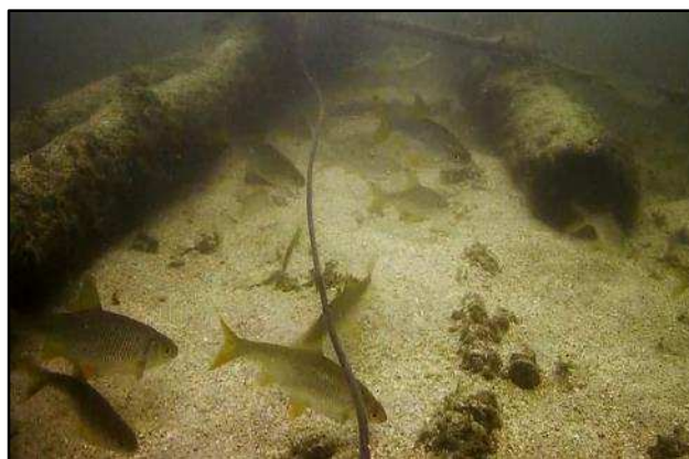
Staw w sąsiedztwie ośrodka - obraz z kamery podwodnej